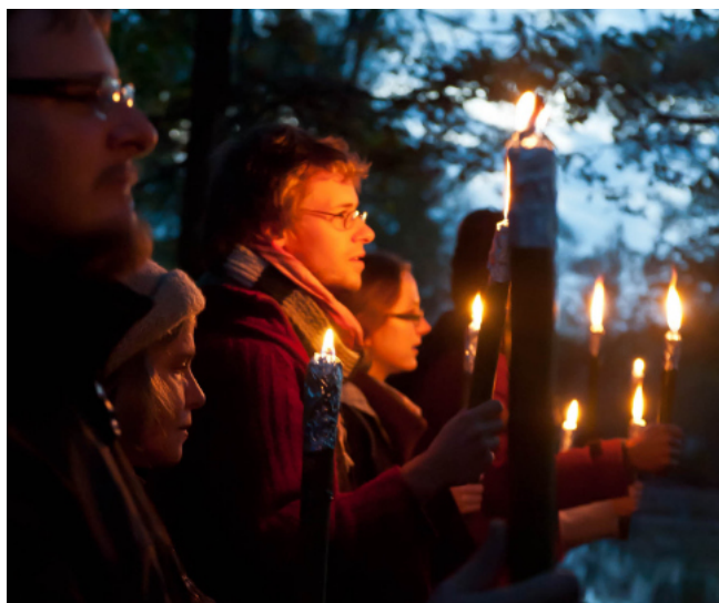
Fête de Saint-Martin au Foyer Michaël

Ainsi nous trouvons-nous entre Toussaint et Noël dans un temps suspendu où, se dégageant de la terre, les âmes et l'âme de chacun perçoivent l'espérance d'une confiante et pacifique évolution.