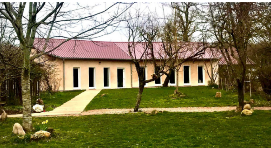
Bâtiment d'accueil et salle de cours du Foyer Michaël

(extrait du courriel du Foyer Michaël du 19/11/2024)